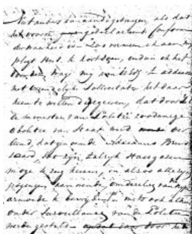
Deel van het verzoekschrift van de Maire van Oud-Beijerland